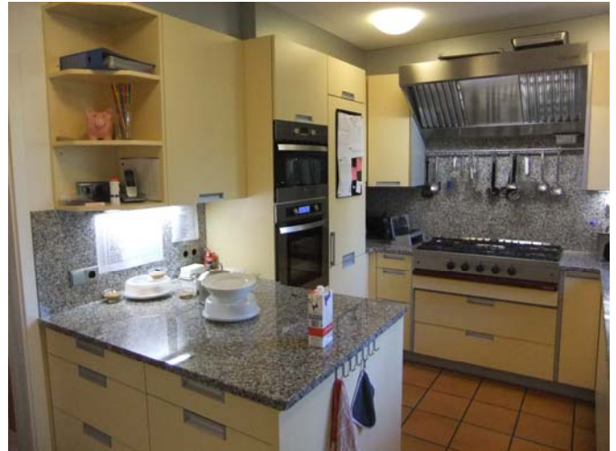
Unsere neue Hospizküche

Nach 18 Jahren intensivster Nutzung fielen an der alten Küche ständig Reparaturen an, die es notwendig machten, über eine Neuanschaffung nachzudenken. Durch die Unterstützung der Stiftung „Endlich leben“, die hierfür einen Teilbetrag übernahm, wurde es Anfang des Jahres möglich, die Küche zu erneuern.