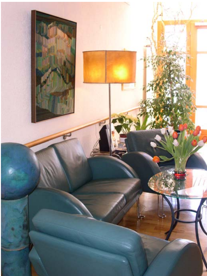
Wohnlichkeit ist sehr wichtig für unsere kranken Gäste