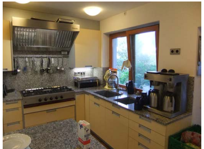
eingrichtet durch die Firma Röhrig, Lohmar

Vor einigen Monaten haben wir begonnen, neue Pflegebetten anzuschaffen. Zwei Betten konnten wir auch hier mit Hilfe der Stiftung „Endlich leben“ ersetzen, ein weiteres durch eine großzügige Einzelspende. Von unseren 16 Zimmern, wurden somit bereits drei Zimmer mit neuen Pflegebetten ausgestattet. Dreizehn Betten fehlen noch und diese wollen wir ebenfalls schnellstmöglich kaufen.