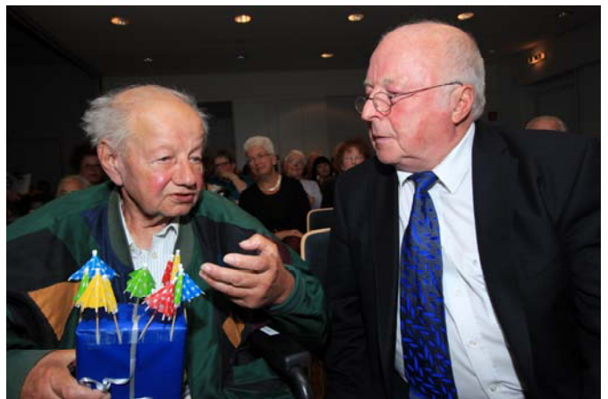
Geschenk mit „Schirmchen“ für den Schirmherrn

tigkeit der Stiftung für die Ausstattung des Hospizes. Er informierte, dass das Hospiz keine staatliche Organisation sei, keinem kirchlichen Wohlfahrtsverband (Caritas, Diakonie) angehöre und somit außerordentlich stark von Spenden, Mitgliedschaften und Zustiftungen abhängig sei. Ziel der Stiftung ist es unter anderem, mit dazu beizutragen, dass die Arbeit des Elisabeth-Hospizes langfristig gesichert werden kann. Bisher unterstützte die Stiftung das Hospiz u. a. durch einen Zuschuss zur neuen Hospizküche, die Renovierung des Schwesternzimmers, den Kauf von zwei Pflegebetten und die Installation einer Rauchmeldeanlage. An dieser Stelle danken wir der Stiftung für diese Unterstützung sehr und hoffen, dass es durch Zustiftungen möglich werden wird, der Arbeit des Elisabeth-Hospizes mehr Planungssicherheit zu geben. Die finanzielle Unterstützung von Stiftungen durch Zuwendungen (Zustiftungen) wird steuerlich besonders gefördert.