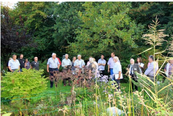
Begehung im Hospizgarten

Eine 19köpfige Bewertungskommission hat drei Ortschaften mit weniger als 300 Einwohnern vor wenigen Wochen mit der Goldmedaille geehrt. Auch unser Dorf, Deesem, erhielt die Goldmedaille. Laut Jury überzeugte Deesem mit einer gut funktionierenden Dorfgemeinschaft und der gelungenen Integration des Elisabeth-Hospizes. Hierdurch qualifizierte sich Deesem gleichzeitig als einziges Dorf für den Landeswettbewerb 2011/2012.