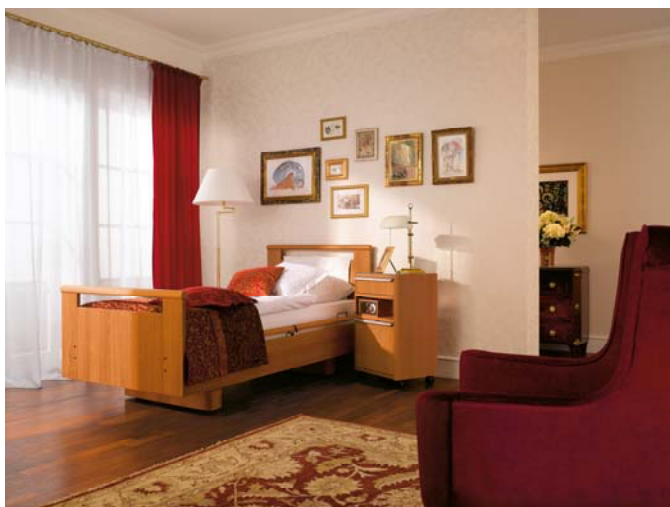
Pflegebetten nach neuestem Standard